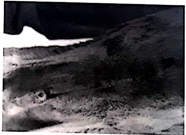
Resim 4. Uygulama grubundaki bir hayvanda operasyondan 10 gün sonraki görünümü (Dikişleri alınmış hali) Figure 4. Appearance of operation site of an experimental group 10 day after Surgery

Dikişlerini açan bu iki köpeğin 8. gün dikişleri alındı (Resim 4).