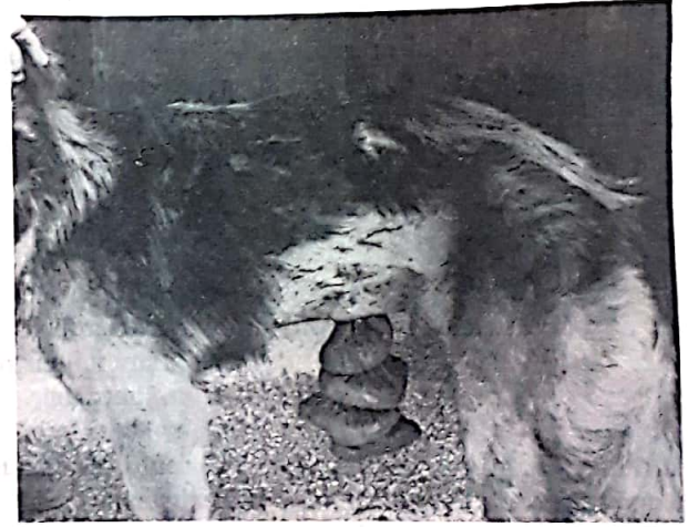
Resim 1. Kontrol grubundaki bir hayvanda operasyondan 6 gün sonra görülen bağırsak evantrasyonu

Kontrol grubundaki hayvanların tümünde operasyondan 3 gün sonra ensizyon bölgesinde kızarıklık ve ağrı mevcuttu. Bu 5 köpeğin 3'ünde deri dikişlerinin yer yer açıldığı görüldü. Dikişleri açılan hayvanlar anesteziye alınarak deri tekrar kapatıldı. İkinci köpeğin 4. günde birkaç dikişinin tekrar açıldığı görüldü. Hayvan anesteziye alınarak bağdoku ve kaslar arası kontrol edildiğinde, buralarda hafif suppurasyonun başladığı dikkati çekti. Bu durumda yara dudakları yenilenip temizlendikten sonra tekrar dikiş uygulandı. Ancak dikişlerin 6. gün tekrar açılarak bağırsakların evantre olduğu tesbit edildi (Resim 1).