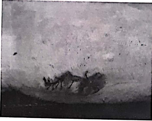
Resim 2. Kontrol grubundaki bir hayvanda operasyondan 7 gün sonraki hali dokular arasında yaygın suppurasyon Figure 2. This showing diffuse suppurative between tissues in a control group dog 7 days after surgery

Bu hayvanda suppurasyon sadece dokular arasında lokal olarak kalmıştı (Resim 2).