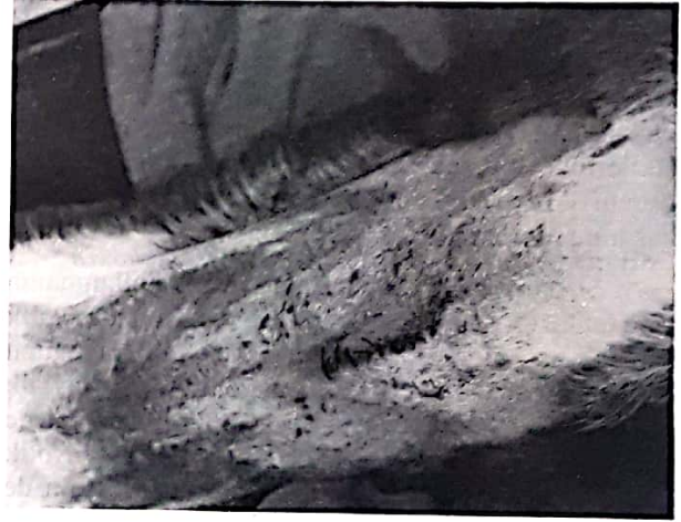
Resim 3. Uygulama grubundaki bir hayvanda operasyondan 8 gün sonraki görünümü (Dikişleri alınmamış hali) Figure 3. Appearance of operation site of an experimental group 8 days after surgery

Uygulama grubundaki 2 köpeğin dişleri ile deri dikişlerini açtıkları tespit edildi. Bunlardan birinin 1. ve 2. gün olmak üzere 2 defa, diğerinin ise 2. gün birkaç dikişini açtığı görüldü. Her defasında dikişlerini açan bu hayvanlar derhal anesteziye alınarak tekrar dikiş uygulandı. Bu esnada deri ve kaslarda herhangi bir komplikasyonla karşılaşılmadı. Bu köpeklerden biri 3. gün deri dikişlerinin birkaçını tekrar açtı, açılan dikişler tekrar uygulandı. Bu hayvanlarda yara iyileşmesi tamdı. Diğer 3 köpekte ise her hangi bir komplikasyon gözlenmedi (Resim 3).