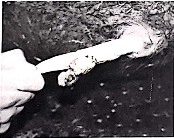
Resim 2. Bir nolu olgumuzda multiple fibropapillomun operasyon öncesi görünümü.

Preputium'dan penisin dışarı çıkarılması esnasında elle yapılan palpasyon ve muayene sırasında hafif olan kanamanın daha da arttığı gözlemlendi. Özellikle glans peniste tümöral kitlenin büyük olduğu olgularda parafimososis saptandı (Resim 1,4,5).