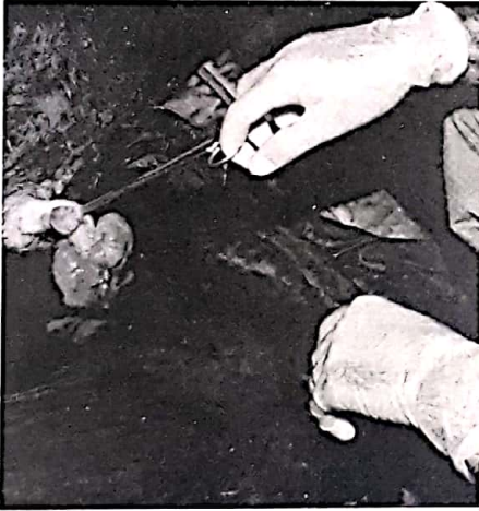
Resim 5. On nolu olguda corpus ve glans peniste parafimosise neden olan multiple fibropapillomlar.

Olgularımızda tümörlerin yerleştiği organ ile bağlantısının zayıf olduğu, operasyonla kolayca uzaklaştırıldığı ve histopatolojik olarak sadece örtü epiteli ve subepitel bağdokusu ile sınırlı olduğu görüldü.