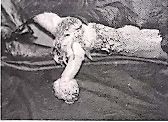
Resim 4. Altı nolu olguda parafimosise neden olan soliter glans penis fibropapillomu.

Tabii tohumlamada kullanılan 2 boğada, hayvan sahiplerinin ifadelerine göre aşım isteklerinde bir azalmanın görüldüğü, bazen aşım esnasında veya sonrasında hayvanlarda bir kanamanın olduğu belirtildi.